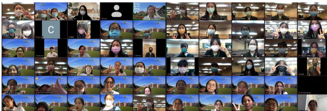
圖 1：雙方師生大合影

在眾所期待下，第十屆綠衣使節與新加坡南洋女子中學的三次交流在九月 16 日拉開序幕。透過這三次線上交流，雙方不僅認識彼此國家文化與校園生活，也在活動中培養團隊合作與默契，更運用 Design thinking 之方法共同解決國際議題，順利在疫情下延續兩校深厚的友誼。